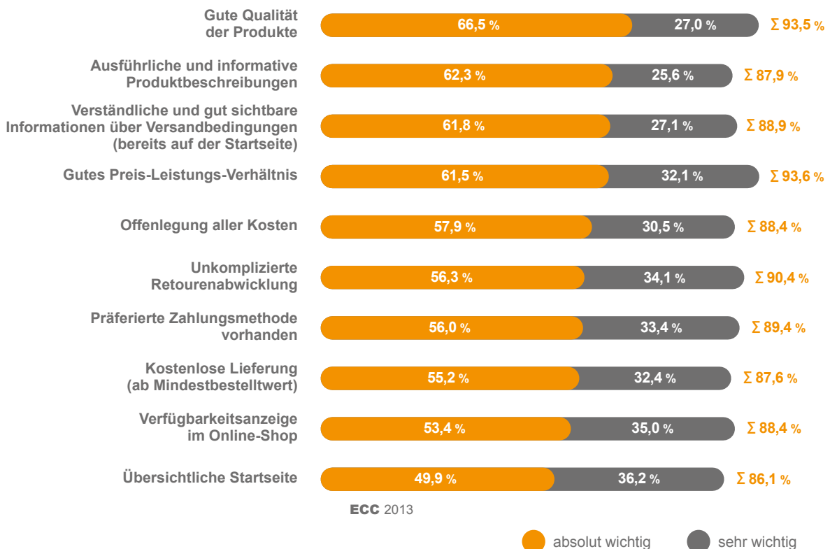
Abb. 3: Die zehn wichtigsten Einzelkriterien beim Online-Einkauf aus Konsumentensicht, 9.588 ≤ n ≤ 10.044; Antwortoptionen „teilweise wichtig“, „eher unwichtig“ und „absolut unwichtig“ nicht dargestellt.

terien bei positiver Erfüllung die Basis für einen erfolgreichen Online-Shop schaffen (vgl. Abb. 3). Beispielsweise kann eine professionelle und aufwendig designte Website den Kunden weniger zufrieden stellen, wenn die Produktbeschreibungen unzureichend sind oder nicht ausreichend Informationen zu Versand und Bezahlung bereitgestellt werden. Umgekehrt können aber gute Produktbilder und informative Produktbeschreibungen auf einer unprofessionellen und unübersichtlichen Seite nicht so wirken, wie es sein sollte. Dabei sind ebenfalls die zielgruppenspezifischen Merkmale und Erwartungen zu berücksichtigen – sowohl im Bereich Website-Gestaltung, als auch in Bezug auf Sortiment oder Bezahlung. Beispielsweise werden Besucher der Website des Herstellers und Softwareanbieters Apple andere Erwartungen an Website-Gestaltung und Design stellen, als die Kunden des Elektronikhändlers redcoon.de mit der Positionierung als Discount-Elektronik-Shop.