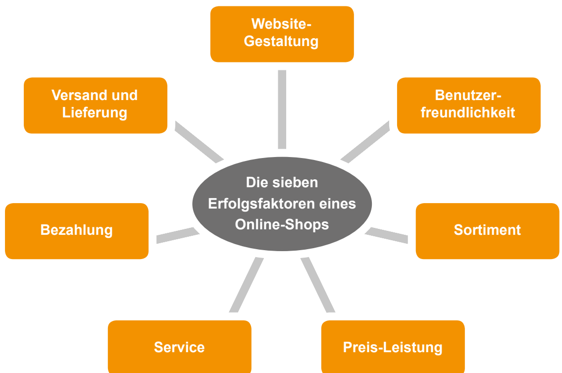
Abb. 2: Die sieben Erfolgsfaktoren im Online-Handel

zu ihrem Online-Shopping-Verhalten, der Wichtigkeit verschiedenster Kriterien beim Online-Einkauf sowie ihrer Zufriedenheit mit Online-Shops befragt. Im Rahmen der ersten Auflage der Studie im Jahr 2012 wurden sieben Erfolgsfaktoren und mehr als 60 dahinter liegende Einzelkriterien identifiziert. Im Erhebungsverlauf bewerteten die Konsumenten insgesamt 100 Online-Shops über elf verschiedene Kategorien hinweg und berücksichtigten dabei die identifizierten, sieben Erfolgsfaktoren Website-Gestaltung, Benutzerfreundlichkeit, Sortiment, Preis-Leistung, Service, Bezahlung sowie Versand und Lieferung (vgl. Abb. 2), die im Folgenden dargestellt und näher erläutert werden.